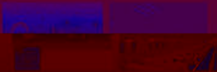
图 6-1-1 产教融合与校企合作